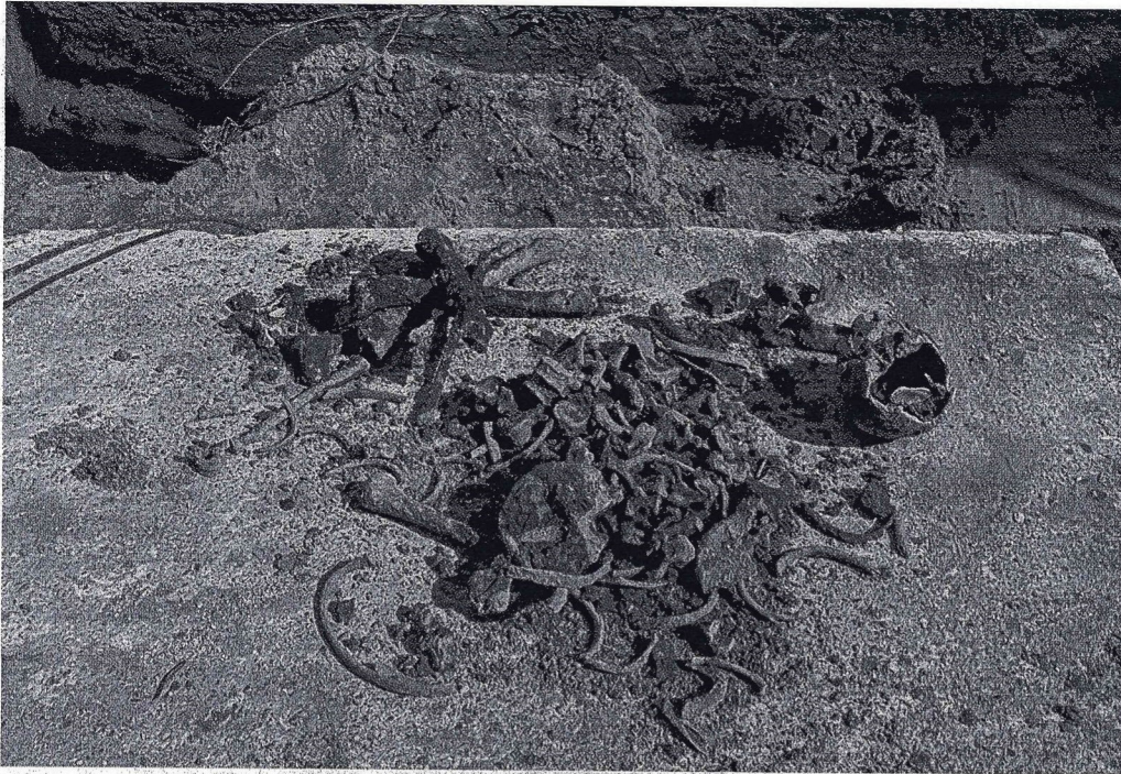
Wenn es auch wie ein Puzzle wirkt: Das Skelett, das die Bauarbeiter in der vergangenen Woche auf dem Hof der Kollwitz-Schule ausbuddelten, ist nahezu komplett.