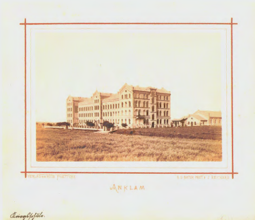
Abb. 3 Jacob Reichard: Neubau der Kriegsschule Anklam, 1871. Archiv Museum im Steintor Anklam.