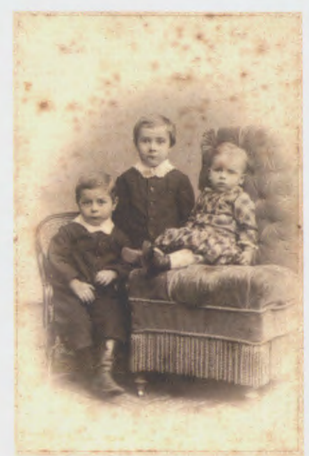
Abb. 5-7 Jacob Reichard: Anklamer Portraits, um 1870.