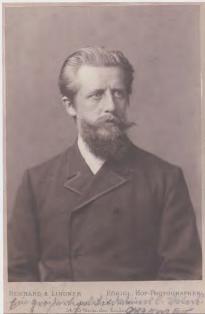
Abb. 1 Jacob Reichard: Portrait des Fotografen Ottomar Anschütz. Archiv Otto-Lilienthal-Museum Anklam.