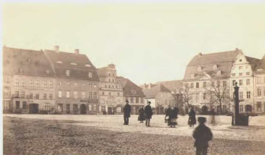
Abb. 20 Jacob Reichard: Anklam, Markt, Blick in südwestliche Richtung, ca. 1870. Archiv Museum im Steintor Anklam.

Das Anklamer Museum im Steintor hat aus den alten Beständen und den Neuerwerbungen des Fotografen Jacob Reichard eine Ausstellung zusammengestellt, die in großformatigen Reproduktionen neben den Stadtansichten auch Anklamer Portraits zeigt, die fast ausnahmslos nicht identifiziert sind. Es bleibt zu wünschen, dass sich angesichts der Ausstellung weitere verschüttete Quellen in vergessenen Fotoalben aufspüren lassen und vergessene Fotografien und Geschichten ans Licht befördert werden. Im Rahmen eines durch das Ministerium für Bildung, Wissenschaft und Kultur des Landes Mecklenburg-Vorpommern geförderten Projektes werden die Bestände wie das Bildarchiv des Museums im Steintor und des Otto-Lilienthal-Museums online zugänglich gemacht. 5