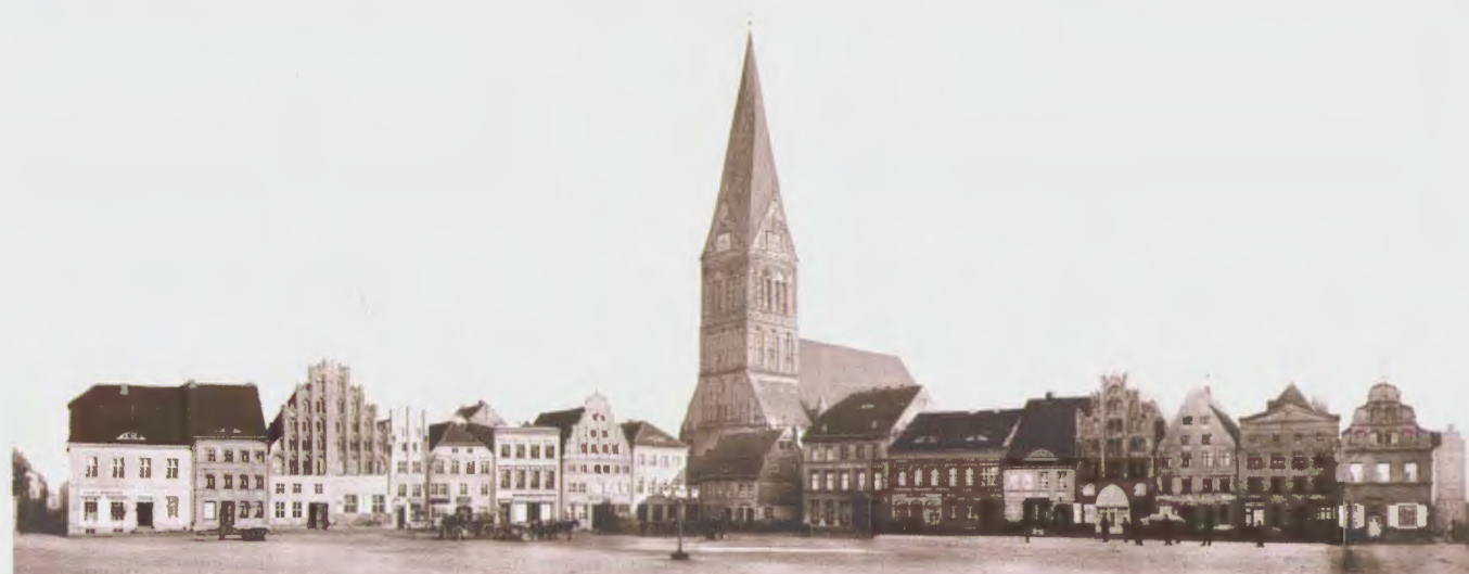
Abb. 21 P. Wittig: Im Jahr 2010 aus drei Fotografien von Jacob Reichard hergestellte Ansicht von Anklam, Markt, Blickrichtung Nordost. Archiv Museum im Steintor Anklam.