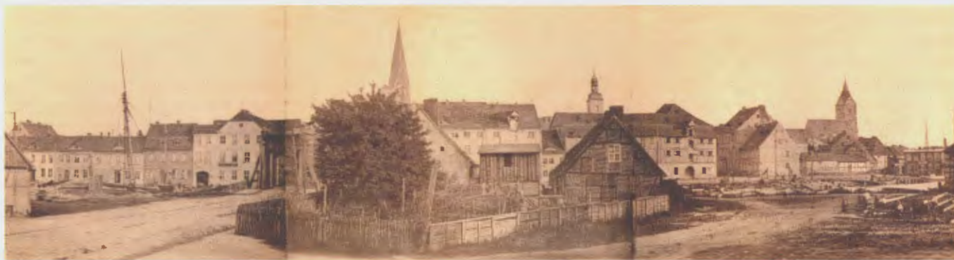
Abb. 19 Jacob Reichard [zugeschrieben]: Panorama vom Peendamm, dreiteilig.

Fotografien der Kirche die Grundlage für ihren begonnenen Wiederaufbau.